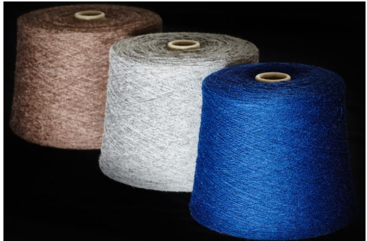
Re.Verso™ yarn by Filatura C4

La collezione nasce per soddisfare esigenze sempre più mirate del mercato che richiedono una crescente specializzazione e responsabilizzazione nel recupero delle fibre tessili. Grazie al sistema Re.Verso™ , l'azienda offre prodotti di qualità e a basso impatto ambientale , attraverso l'utilizzo di ritagli di tessuti di confezione pre-consumer di lana raccolti, selezionati e processati in un modo accreditato, totalmente trasparente e tracciabile. La collezione Re.Verso™ è principalmente impiegata nell'arredamento contract e domestico.