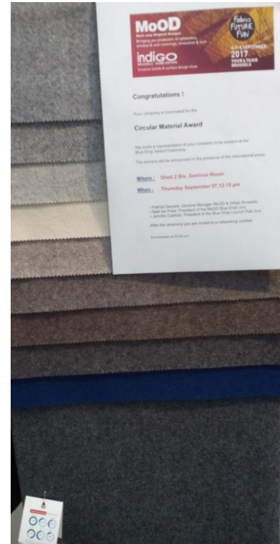
Tessuto Floris di Audejas con la lana Re.Verso™ di Filatura C4

Oggi a Filo, Filatura C4 presenta un tessuto di Audejas , produttore lituano di upholstery e tessile casa dal 1946, realizzato per il 75% di lana (55% lana Re.Verso™) in mischia con 20% poliammide e 5% altre fibre. Questo prodotto ha ricevuto il Blue Drop Award durante la seconda giornata di MoOD 2017. MoOD Bruxelles è un'esposizione dedicata ai produttori di upholstery, coperture per finestre e pareti per i mercati residential e contract. Blue Drop è un'overview dei migliori prodotti degli espositori di MoOD creata per ispirare i visitatori. Unico nel suo genere in quanto è il solo marchio di qualità al mondo per il tessile per interior. Il tessuto "Floris" di Audejas ha vinto il primo premio nella categoria "Circular Material", in quanto prodotto realizzato con l'obiettivo di ridurre gli sprechi grazie all'utilizzo di materiali sostenibili.